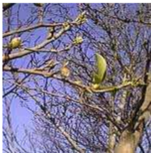
サザンカは落葉樹？ 03.10.30 撮影

多くの野草にとって冬は休眠の季節です。しかし、ちょっと探してみると、案外咲いている花も多いことに気づきます。いくつかをご紹介しますよ。