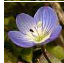
オオイヌノフグリ 00.02.12 撮影