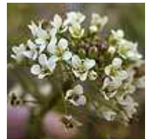
ナズナ 00.02.12 撮影

下の写真は菜の花に似た花ですが、何でしょうか。図鑑で見るとハナナというのに似ています。遺跡資料館の前の水路脇で冬の日差しを浴びていました。おそらく、本来はもっと暖かくなってから咲く花でしょう。