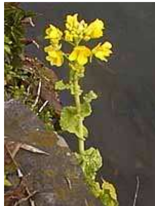
ハナナ？ 00.01.27 撮影

寒風の吹き抜ける冬の野の片隅でこのように健気に咲いている花を見つけると、元気がわいてきます。ただ、ここでご紹介した花は、何かの条件や偶然が重なって咲いたのかも知れません。毎年同じ花が咲くかどうかはわかりません。逆に言えば、もっと他の花にお目にかかるチャンスもあり