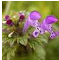
ホトケノザ 00.01.08 撮影

これはホトケノザです(春の七草のホトケノザとは別物だそうです)。春暖かくなってからよく見られる花ですが、まだ寒い間から咲いていることもあります。