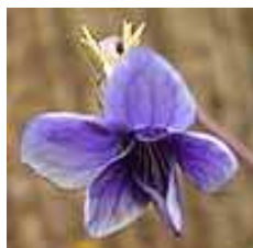
小さなスミレ 99.12.26 撮影

かりません。第二次大極殿の北隣にある内裏跡で、溝の石組の間に咲いていました。こんな養分の少なそうな場所でよくがんばって咲いているものだと思いましたが、溝掃除のときに容赦なく抜かれてしまいました。石組の間に植物の根がはびこることは遺跡保全のためには好ましくないのかも知れません。