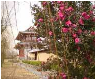
サザンカ 00.01.08 撮影

冬の平城宮跡で目につく花は、“野草”ではありませんが、サザンカです。朱雀門付近が一番多いのですが、他にもあち